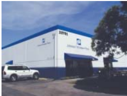
Johnson ( 强生 ) 玻璃膜公司